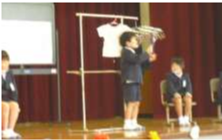
1・2年生の発表 「ありがとうがいっぱい」