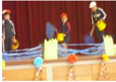
3年生の発表 「重安いいこと見つけ隊」