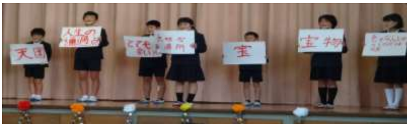
5・6年生の発表 「ありがとう重安小～そして未来へ向けて～」